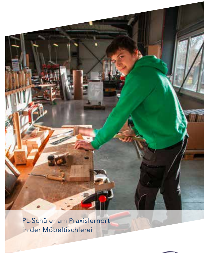
PL-Schüler am Praxislernort in der Möbeltischlerei

Für Jugendliche in den Jahrgängen 8 und 9